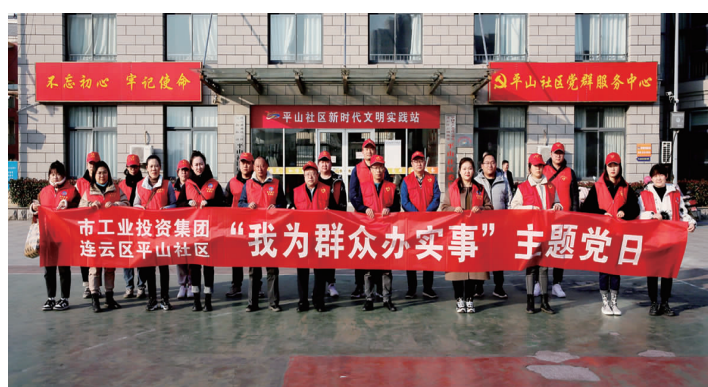
连日来,集团公司各级党组织围绕“我为群众办实事”主题党日,结合“万名党员走千村(社区)访万户”活动,组织党员走进结对共建村(社区),扎实开展“大走访、大排查、大服务”活动,推动解决群众“急难愁盼”问题。(工宣)