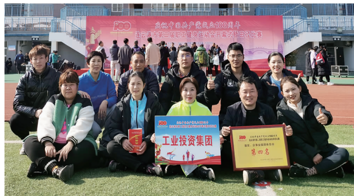
11月27—28日,连云港市第二届职工健身运动会田径比赛在江苏海洋大学举行。集团公司组成10人田径代表队参加100米、铅球、跳高、跳远等15个比赛项目,斩获集体奖1项,单项奖10项,总分在县区、企业组中排名第四。(工宣 工会)

位淘汰、追责问责为主要形式的人员能上能下的人事制度,切实做好人才发展规划和激励政策。提倡和鼓励员工通过自学等方式获得相应文凭、资质和职称。三是建立以全员绩效考核为核心,以岗位绩效工资制为主要形式,与企业经济效益紧密结合的收入能增能减的薪酬分配制度,力争打造用工结构更加优化、人员配置更加高效、激励机制更加健全、收入分配制度更加规范的新局面,为高质量发展提供坚强保障。(金航 宣)