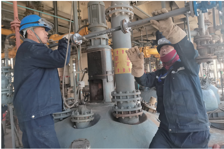
为应对严寒天气,利海化工公司各生产装置预先做好防冻分析,对可能出现冻堵的设备管道提前设置蒸汽伴热,确保严寒天气不冻堵,确保装置稳定运行。图为工人安装蒸汽伴热管道。