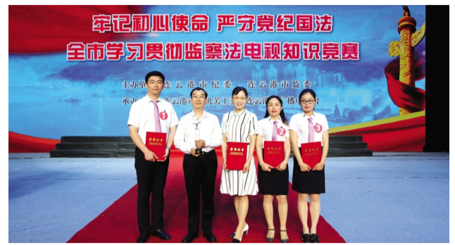
6月25日下午，集团公司代表队作为我市唯一晋级决赛的国企参赛队，在由市纪委监委举办的“牢记初心使命、严守党纪国法”学习贯彻监察法电视知识竞赛(决赛)中荣获二等奖和优秀组织奖。(工宣工纪)