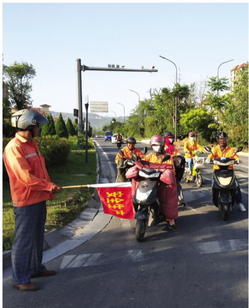
今年是我国第16个安全生产月,华茂裕升养护公司把交通安全工作作为安全月重点工作,从6月1日开始对管辖区域内5个员工上下班比较集中的红绿灯路口实行安全小红旗站岗,每天上下班4岗到位,确保员工上下班交通安全。(薛清)

八期工程属于氨纶公司5年发展3步走的关键一环,也是省重点开工项目、市重大项目跟踪推进工程。目前整个工程围绕早投产早达效这一目标,按照“安全第一、质量至上、严控造价、赶超工期”的整体思路大力推进项目建设,为未来生产运行稳定、产品品质优良保驾护航。(氨纶宣)