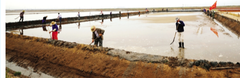
6月22日上午，徐圩投资公司党委组织全公司200名在岗党员集中开展“先锋行动党旗红”奉献日活动，平填亩格池100米、疏通排淡沟1000米、加固下马格池200米、安土土工布150米、扎“泥隔”230米，及时为生产单元进一步加固防汛抗灾工程。（王茜）