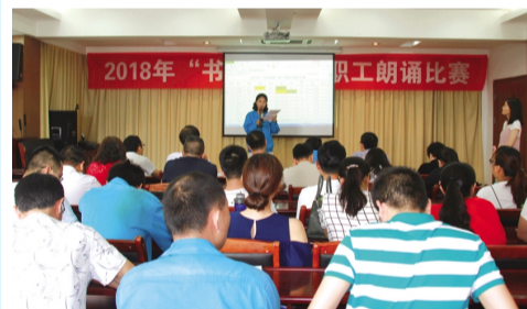
6月22日，金桥制盐公司举办“书香金桥”职工朗诵比赛，迎接“七一”党的生日，抒发职工爱党爱国情怀，引导职工爱企奉献、爱岗敬业。（金工）