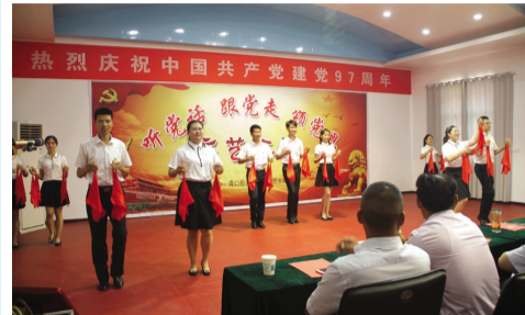
6月26日下午，青口投资公司机关党支部精心准备了一场“听党话、跟党走、颂党恩”文艺汇演，载歌载舞迎接党的97岁生日。（顾益）