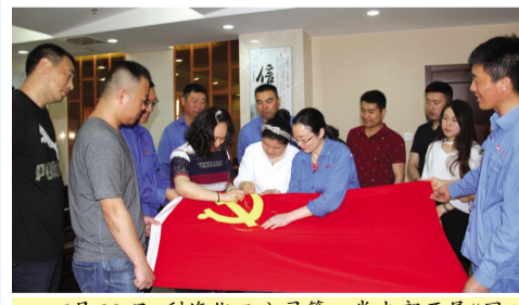
6月22日，利海化工公司第一党支部开展“同心绣党旗，红心向党”教育活动，每位党员纷纷参与刺绣过程，用手中的针和线为党旗增添几缕金丝，将对党的忠诚、热爱坚定在心灵深处。（顾孟）