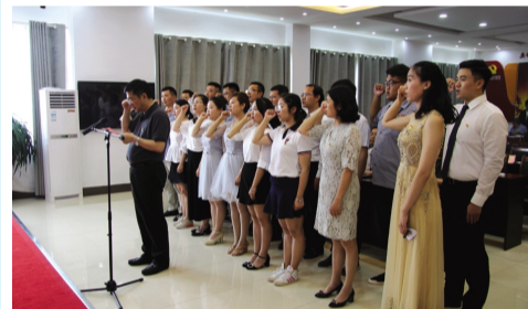
6月28日下午，奥神新材料公司党支部举办以“歌党情、颂党恩、走进新时代”为主题的歌咏大赛，并组织广大党员重温入党誓词。（董月茜）