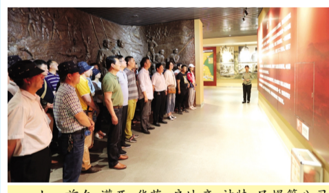
七一前夕，灌西、华茂、房地产、神特、民爆等公司，纷纷组织党员和入党积极分子前往孟良崮战役纪念馆和沂蒙红嫂纪念馆等红色教育基地，参观学习，缅怀先烈先辈，接受爱国主义教育。（综合报道）