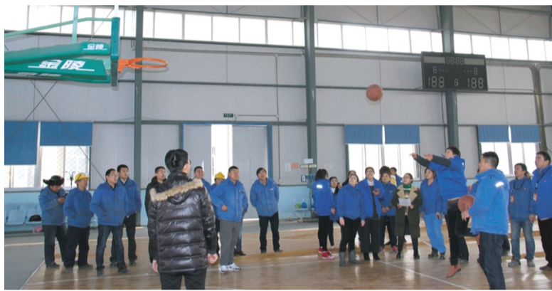
新春佳节来临之际,为深化企业文化活动内涵,营造开心愉悦、团结协作的氛围。1月22日至26日,利海化工公司举办了“迎新春”文体活动周,来自公司各条战线560人次员工参加了活动周。(梁娟)

深入开展丰富多彩娱乐活动。“三八”前夕,组织以“亲近大自然、展示巾帼美”为主题的东海一日游活动;5月份,组织女工参加集团公司女工委开展“炫巾帼风采、舞幸福生活”健身操舞比赛;组织36名女工参加公司举办的庆“五一”迎“五四”登山比赛;“七一”前夕,组织4名女工参加集团公司举办的“颂党恩·赞工投”诗朗诵比赛。(电宣)