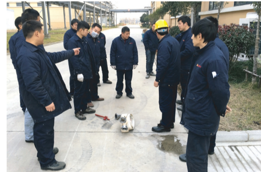
日前,奥神新材料公司邀请消防知识培训专员,到公司为全体员工讲解消防知识,示范消防救援工具使用方法。经过几次培训与演练,公司员工的消防意识得到明显提高,救援技能得到了提升。(奥神新材料宣)

狠抓隐患治理。牢固树立“隐患就是事故”的理念,建立健全全员、全过程、全方位的安全隐患排查治理制度。分类建档、跟踪督办、销项管理,通过日常监督检查、随机抽样巡视、集中排查整治等多种形式,深入查找各类问题隐患,让各类安全隐患无处“潜伏”,促进公司安全形势持续稳定向好。(金安)